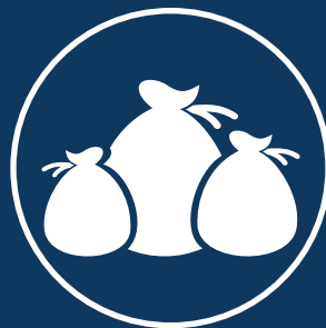
Robo de bulto por entero