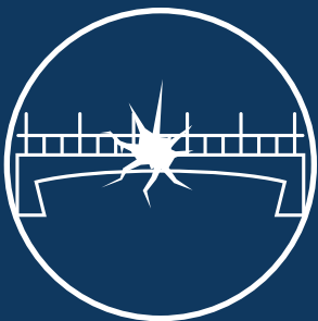
Rotura de Puentes