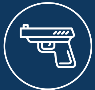
Robo o Asalto con uso de violencia