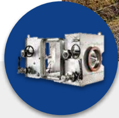
Laboratorios y Bio contención