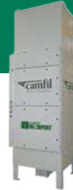
HANDTE OIL EXPERT