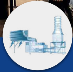
Filtros para Generadores de Energía