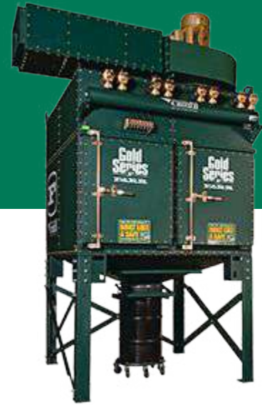
FARR GOLD SERIES

Colector de cartuchos para Polvos y Humos