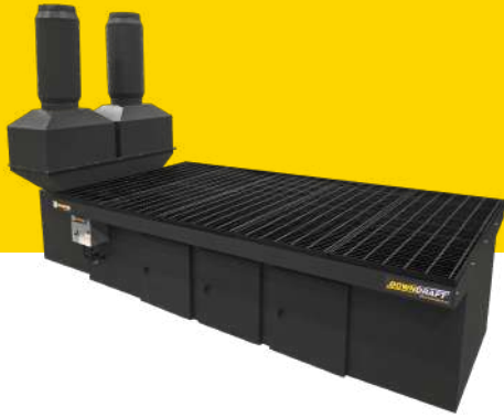
MESA COLECTORA PARA CORTADORA DE PLASMA

Sistema de detección y supresión de chispas, para ventilar la mesa de corte plasma CNC.