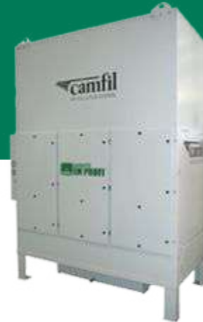
HANDTE EM PROFI