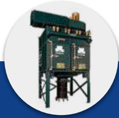
Colectores de Polvo