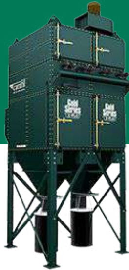
X-Flo GOLD SERIES

Colector de cartuchos para Polvos y Humos