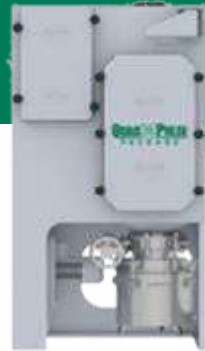
QUAD PULSE PACKAGE

Colector de cartuchos Sector Farmacéutico