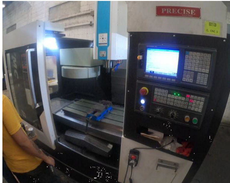
CENTRO DE MAQUINADO VERTICAL